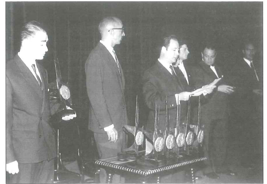
Año 1965. Los primeros Premios Nacionales que tuvieron trofeo propio, se entregaron en el Teatro Villamarta, en el intermedio de un gran festival.